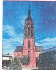
Bartholomäusfigur in St Bartholomäus, Zeilsheim