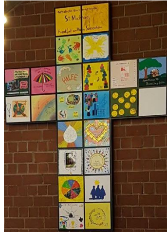
Gemeindekreuz aus gestalteten Kacheln der Gremien, Gruppen und Kreise

Spendenkonto: Frankfurter Volksbank IBAN: DE 73 5019 0000 6200 1867 27 BIC: FFVBDEFF