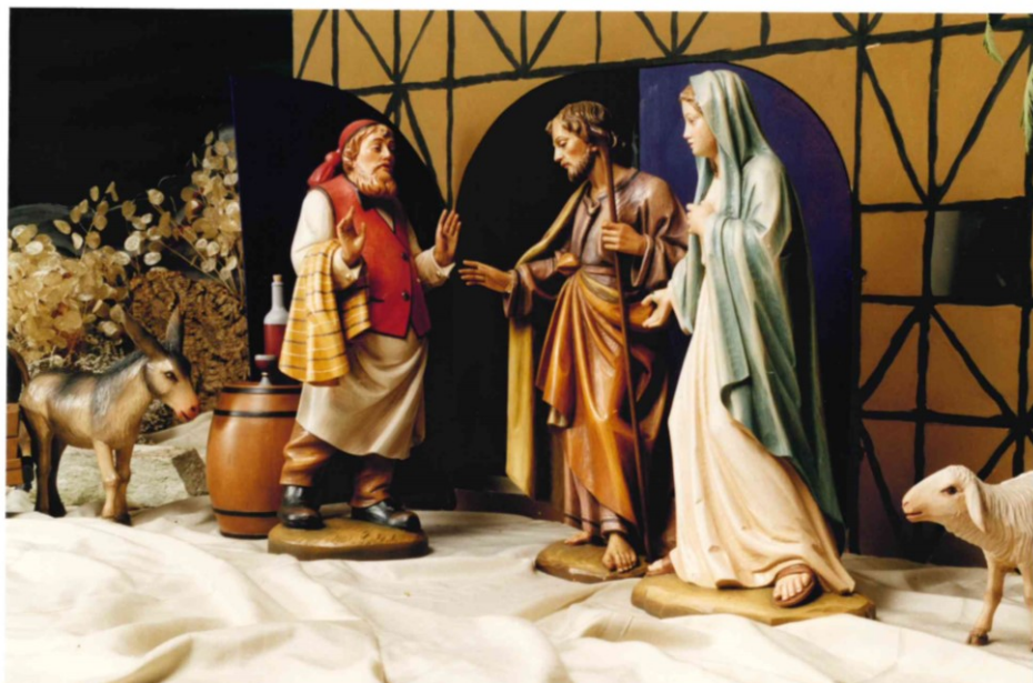
Weihnachtskrippe St. Michael (Herbergssuche)

Nr. 12/1 18.12.2022 –15.01.2023 5/6. Jahrgang