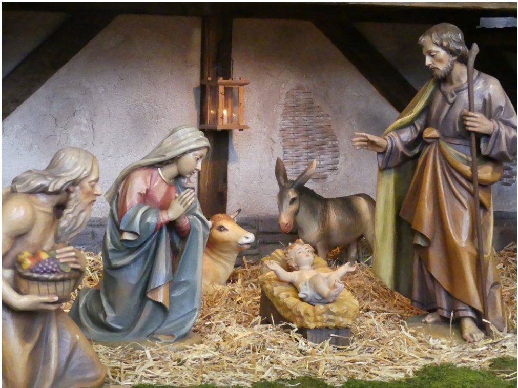
Weihnachtskrippe St. Michael (Detail)

Nr. 12/01 12.12.2021 –09.01.2022 4./5. Jahrgang