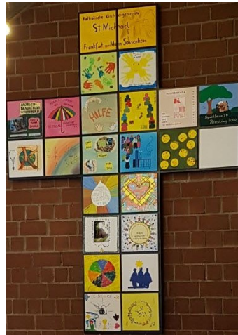
Gemeindekreuz aus gestalteten Kacheln der Gremien, Gruppen und Kreise

Spendenkonto: Frankfurter Volksbank IBAN: DE 73 5019 0000 6200 1867 27 BIC: FFVBDEFF