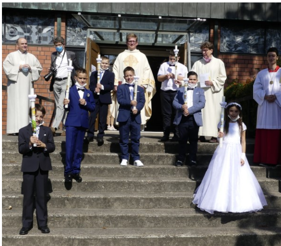
Kleine Erstkommunionfeier am 13.9.2020