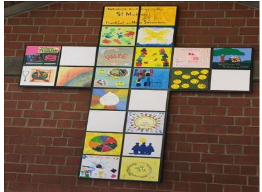
Gemeindekreuz aus gestalteten Kacheln der Gremien, Gruppen und Kreise

Spendenkonto: Frankfurter Volksbank IBAN: DE 73 5019 0000 6200 1867 27 BIC: FFVBDEFF